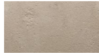
Natur incoloro: hormigón