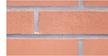
Natur incoloro: ladrillo